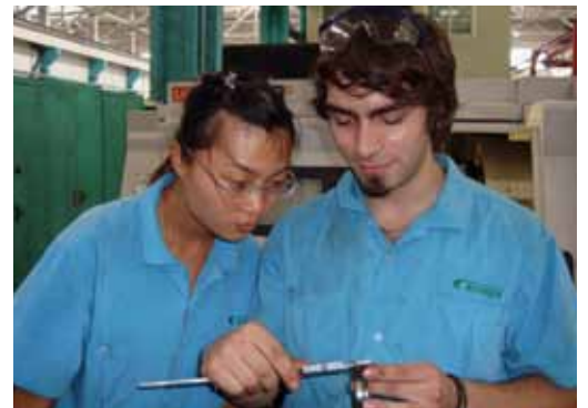
Zu zweit funktioniert die Qualitätskontrolle besser

für das Programm bewusst ein Land gewählt, das sich in vielerlei Hinsicht völlig von der Schweiz unterscheidet.