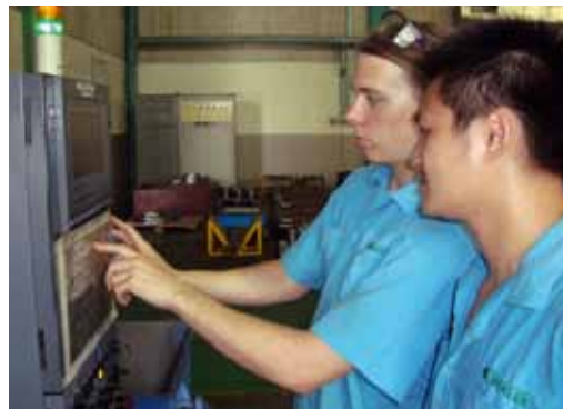
Gemeinsam wird das CNC-Programm optimiert